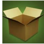
인쇄되지 않은 포장상자